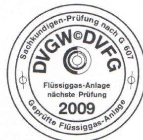
Bild 1 alte Plakette bis 2012 eingesetzt

Darüber hinaus macht eine Veränderung der Technischen Regeln Flüssiggas (TRF2012) eine weitere Anpassung der Plakette erforderlich. Die TRF 2012 ermöglichen unter bestimmten Voraussetzungen, Flüssiggas-Anlagen in Mobilheimen sowie in Forsthütten und Gartenlauben nach EN 1949 zu errichten und nach DVGW-Arbeitsblatt G 607 zu betreiben und zu prüfen.