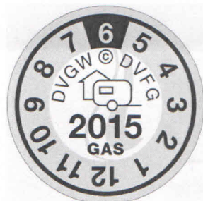
Bild 2 neue Plakette

Die neue Plakette wurde anhand diverser Vorschläge und Eingaben aus der Praxis entwickelt und zeichnet sich durch eine modernere, klarer strukturierte Erscheinung aus und vermittelt mehr relevante Information.